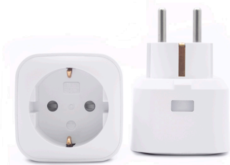
MYCR-3500 PLUG-IN ON/OFF

Miljø: Ikke utsett produktet for sterk varme eller kulde, siden det kan skade eller kortslutte de elektroniske kretskortene.